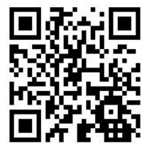
三芳町 HP 二次元コード

三芳町役場 総務課 職員担当 住所：〒354-8555 埼玉県入間郡三芳町大字藤久保 1100-1 電話番号：049-258-0019 (内線 407・408) 三芳町ホームページ： https://www.town.saitama-miyoshi.lg.jp