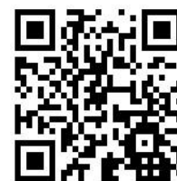
三芳町 HP 二次元コード

三芳町役場 総務課 職員担当 住所：〒354-8555 埼玉県入間郡三芳町大字藤久保 1100-1 電話番号：049-258-0019 (内線 407・408) 三芳町ホームページ： https://www.town.saitama-miyoshi.lg.jp