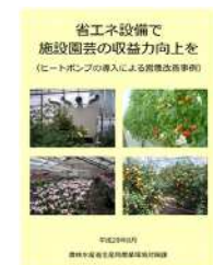
▲省エネで収益力向上を