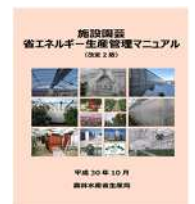
▲省エネマニュアル