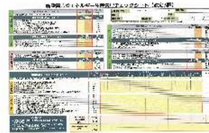
▲省エネチェックシート