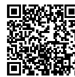
▲省エネ通知のページQRコード