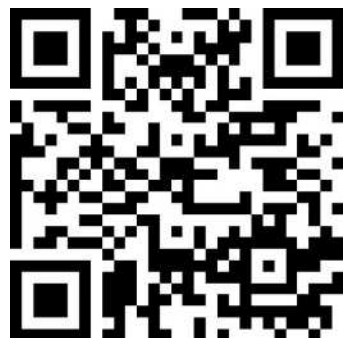
電子申請サービス二次元バーコード