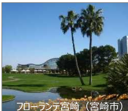
フローランテ宮崎 (宮崎市)