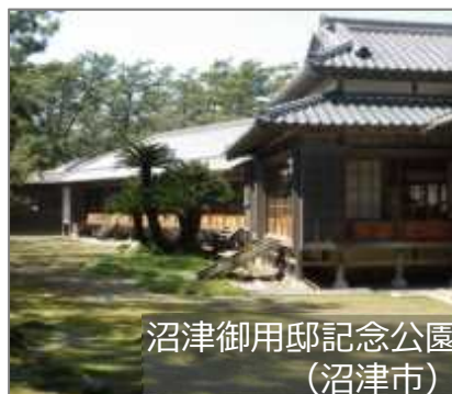
沼津御用邸記念公園 (沼津市)