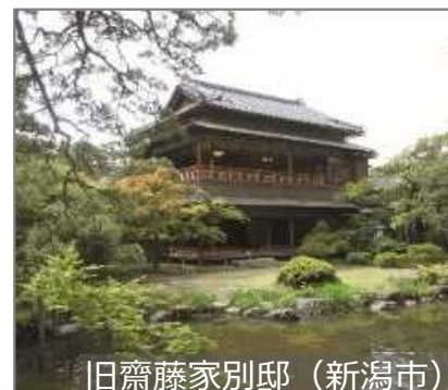
旧齋藤家別邸 (新潟市)