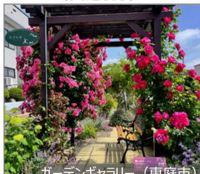
ガーデンギャラリー (恵庭市)