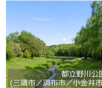
都立野川公園 (三鷹市/調布市/小金井市)