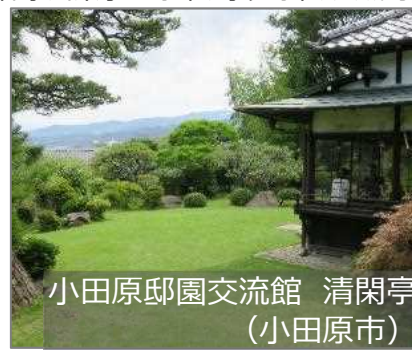
小田原邸園交流館 清閑亭 (小田原市)