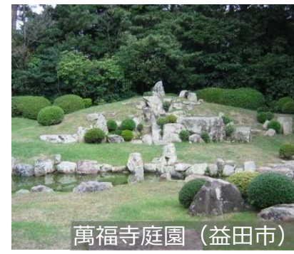
萬福寺庭園 (益田市)