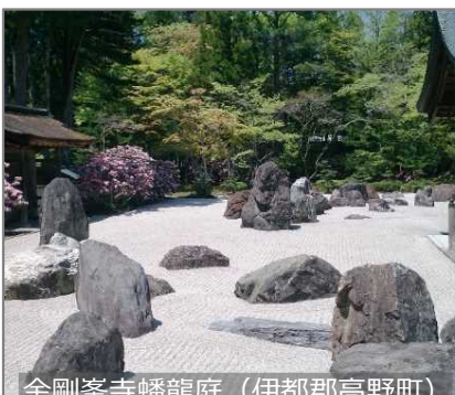
金剛峯寺蟠龍庭 (伊都郡高野町)