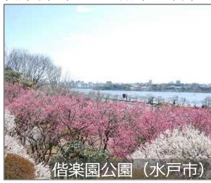
偕楽園公園 (水戸市)