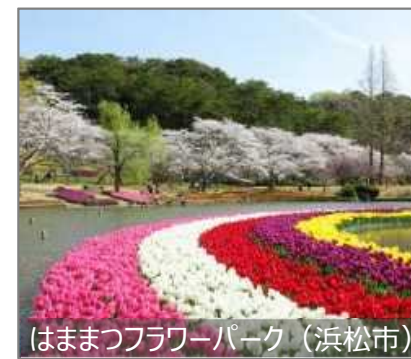
はまつフラワーパーク (浜松市)