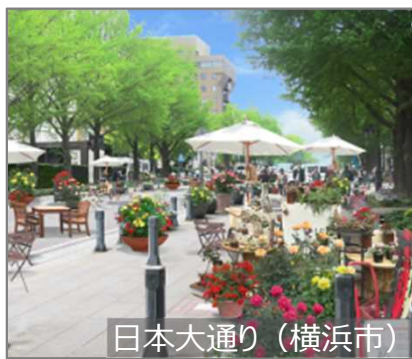
日本大通り (横浜市)