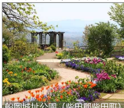
船岡城址公園 (柴田郡柴田町)