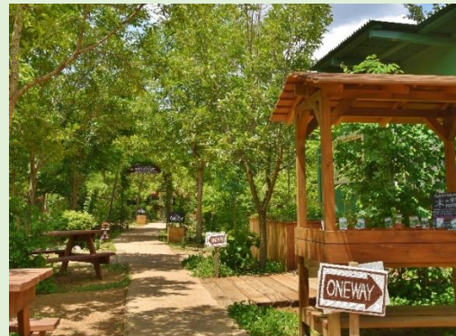
三富今昔村(三芳町)

日本農業遺産に認定された平地林、屋敷、畑が連なる江戸時代より続く風景の中で、雑木林の中を駆け回り、芋を掘り、環境を学ぶ。里山・農・花を巡る小さな旅。