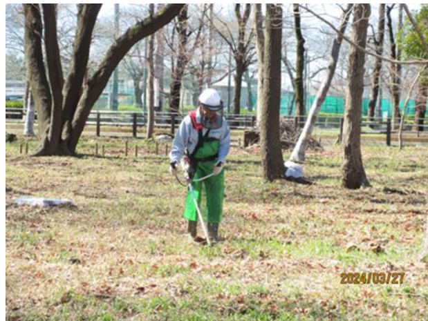
刈り込み後の林床