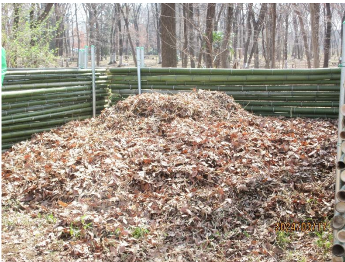
落葉が少しですが山になり堆肥置き場らしく なりました