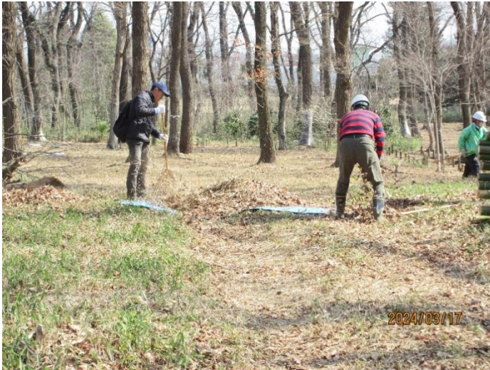
落ち葉を集めています