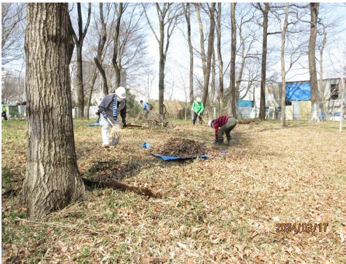
落ち葉を集めて、ビニールシートに乗せて、 新堆肥置き場まで力を併せて運びます