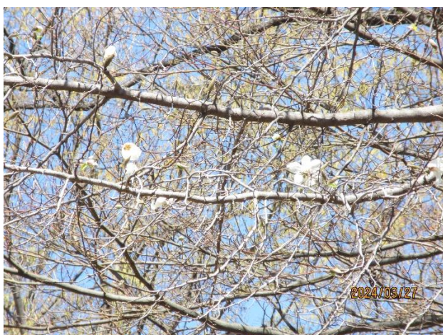
青空とコゲラ(久しぶり)