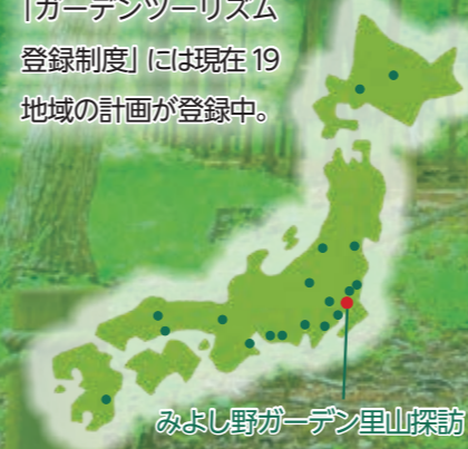
みよし野ガーデン里山探訪

地域にある複数の庭園をテーマのもとで結びつけ、魅力的な体験や交流を創り出す取り組み。国土交通省の「ガーデンツーリズム登録制度」には現在19地域の計画が登録中。