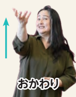
お椀を 持ち上げるように