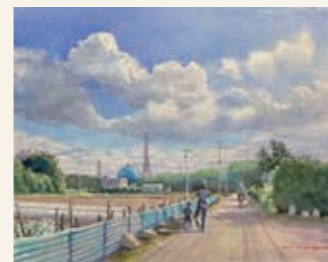
「野菜の町の空」藤久保 野田泰