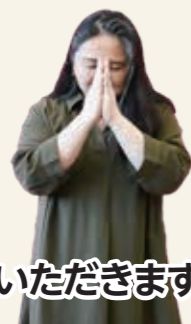
手を合わせて そっとおじぎ