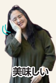
ほっぺに手をあて トントンと軽くたたく