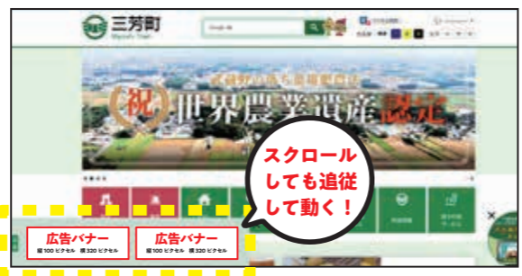
パソコンでの表示イメージ