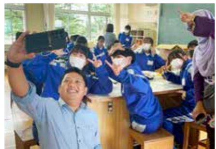
中学校で子どもたちと交流。同じ時間を過ごすことで、にぎやかなつながりが生まれました。