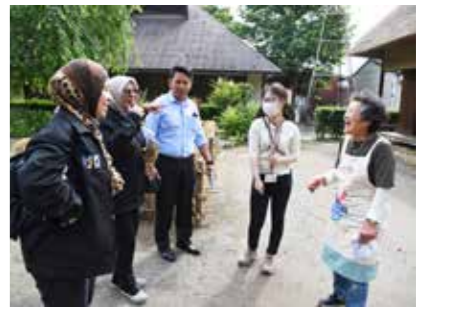
町の人との関わりで生まれた、たくさんの笑顔。言葉の壁を越えて心がつながります。

月1日(木)、旧島田家住宅にマレーシアから来た4人の姿がありました。姉妹都市であるペタリングジャヤ市(PJ市)から「三芳の良いところを見て学びたい」と来日。5月12日(金)から6月9日(金)の約1か月間滞在しました。