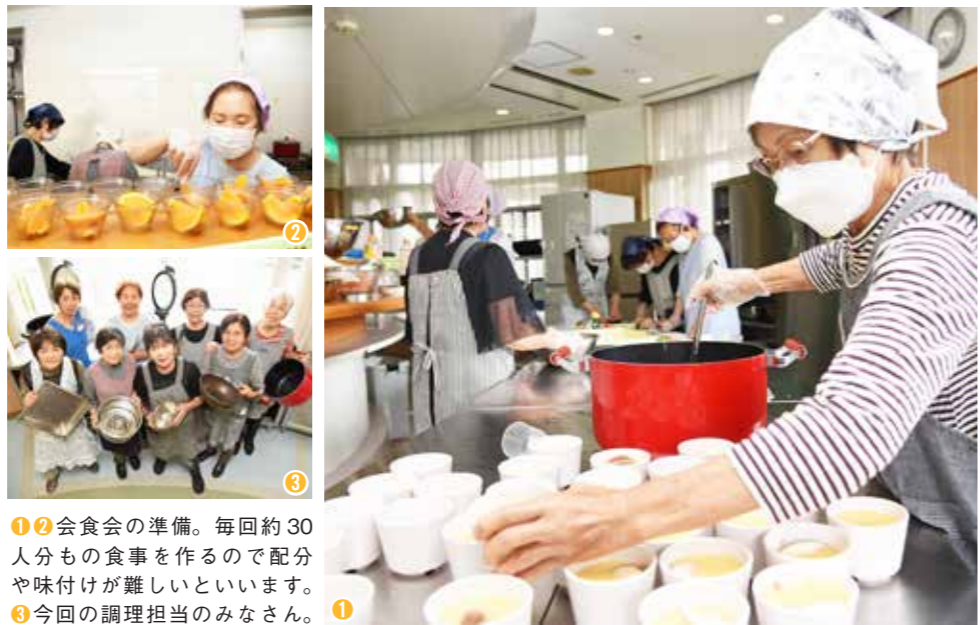
1 会食会の準備。毎回約30人分もの食事を作るので配分や味付けが難しいといえます。 2 今回の調理担当のみなさん。 3