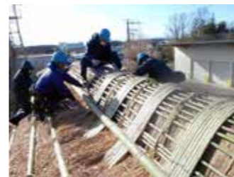
▲茅束、トタン板、杉皮、竹すのこの順に被せ、全てを割竹で押さえるグシの仕上げ作業。

グシとは、屋根の一番上の部分で、風雨から家を守る重要な箇所です。作り方は、①グシと平行に茅の束を並べて重ねる②その上にトタン板を被せる③さらに杉皮、竹すのこを順番に被せる④それら全てを割竹でしっかり押さえ、完成。下から見上げて中まで見えない