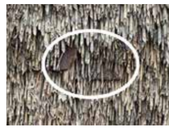
▲軒先近くの茅の中に、挟み込まれた杉皮の一部が見える (白丸部分)。

グシにも使われている杉皮は、雨が茅の中へ入らないようにする防水の役割があります。この杉皮、実はグシだけではなく、降った雨が一番溜まりやすい屋根の軒先付近にも使われています。目立たないよう茅の中に挟み込まれているのでわかりづらいですが、よく観察すると見える所もあります。