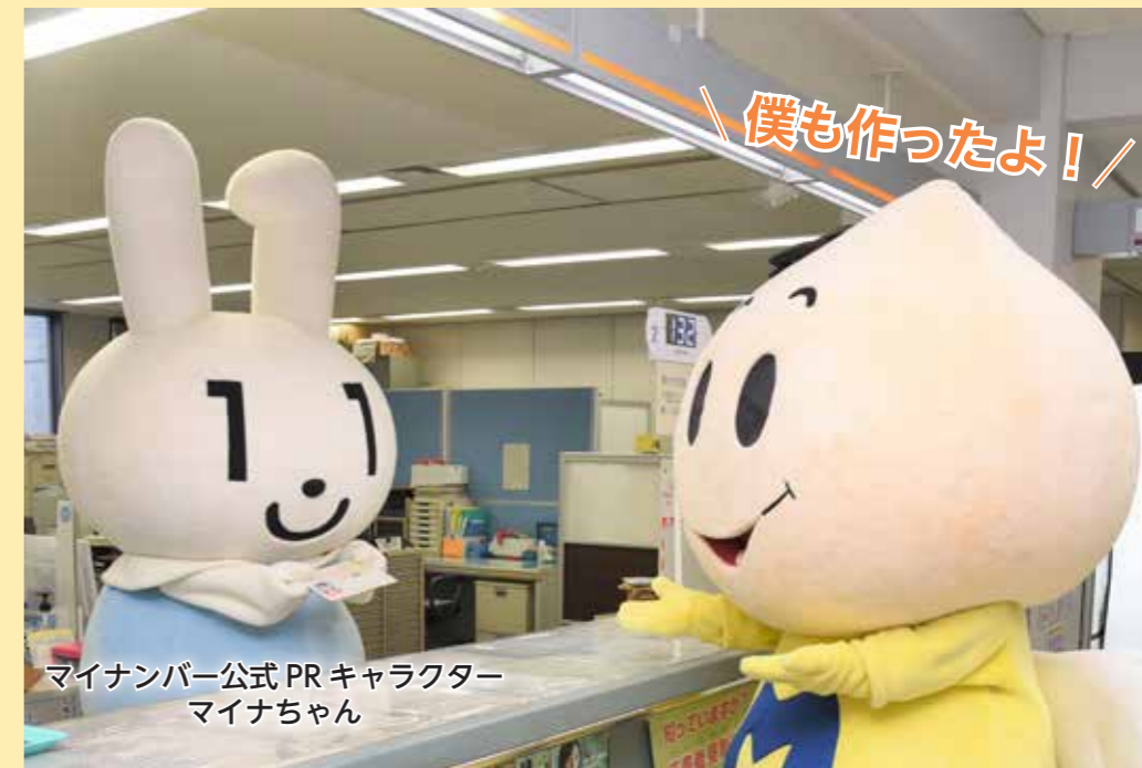
マイナンバー公式 PR キャラクター マイナちゃん

マイナンバーカードは IC チップ付きカードで、券面に氏名・住所・生年月日・性別・マイナンバー (個人番号)・本人の顔写真等が表示されます。本人確認のための身分証明書として利用できるほか、カードの電子証明書を利用して様々な自治体サービスや e-TAX などオンライン申請できるようになります。まだ作成していない人はぜひ申請してください。なお、申請から交付まで 1 ~ 2 か月かかります。受取は必ず本人が来庁してください。