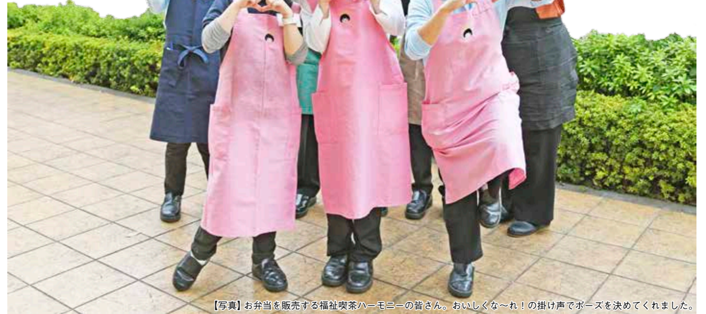
【写真】お弁当を販売する福祉喫茶ハーモニーの皆さん。おいしくな～れ！の掛け声でポーズを決めてくれました。