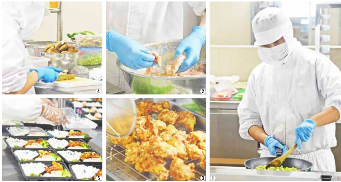
①食材を手早く炒めます。②③この日のメインディッシュ、手作りの唐揚げ。④煮物などの野菜も利用者が丁寧にカットしています。⑤彩り豊かなお弁当が完成。