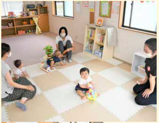
カメラ慣れしていた、今回の赤ちゃんたち。決めポーズや笑顔など、いろいろな表情を見せてくれました。

6月11日(金)、子育て支援センターで行われたなかよし広場に、3組の親子が参加しました。赤ちゃんたちはいろいろなものに興味津々。たくさんのおもちゃで楽しく遊びました。なかよし広場は感染症対策を実施して開催しています。詳しくはP26をご覧ください。