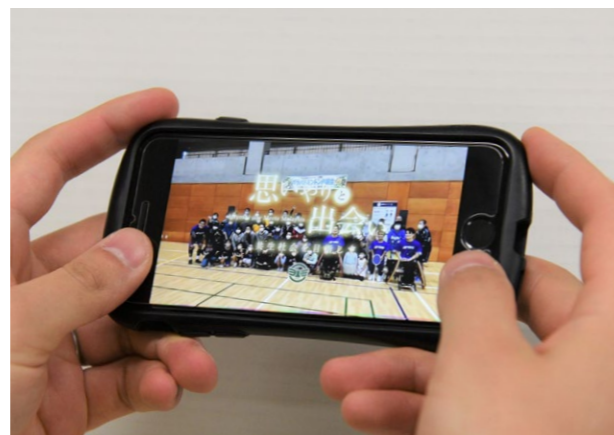
↓タイトルは「思いやりと出会い」。ぜひスマホで視聴を！

2月2日(火)、埼玉県トラック協会所沢支部から交通安全DVDが贈呈されました。DVDの映像に出演しているのは、トラック協会の会員の皆さん。トラックの周りでの交通事故を防ぐために気を付けることを、子どもたちにもわかりやすく説明した内容となっています。このDVDは町内の小中学校での交通安全啓発活動に活用させていただきます。