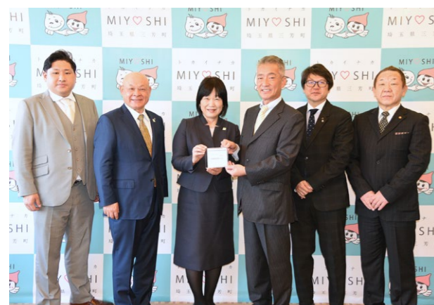
↓子どもたちの安全のために、啓発活動に活用します。

一般財団法人自治総合センターでは、宝くじの社会貢献広報事業として、宝くじの受託事業収入を財源に、コミュニティ助成事業を実施しています。今年度は、新たに竹間沢第1区が助成金を受け、アルミテント、横断幕、折り畳み椅子、ポータブルガス発電機、バルーン投光器等を購入しました。イベント等で活用され、地域の交流がより一層深まります。