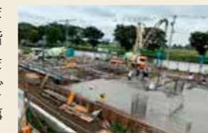
進捗状況(9月中旬現在) 庁舎棟スラブコンクリート打設工事

当組合では、「自己完結型の開かれた消防庁舎」、「機能的消防庁舎」をコンセプトとし、東消防署富士見分署の庁舎移転整備を進めています。工事期間中、近隣の皆様にはご迷惑をおかけしますが、より良い消防サービスを図るために必要な工事ですので、ご理解とご協力をお願いします。