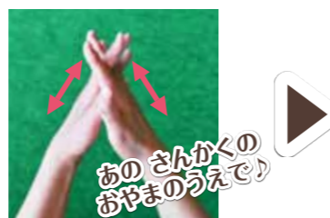
③手を合わせる形で両手の指を交差させて指の間を洗う。