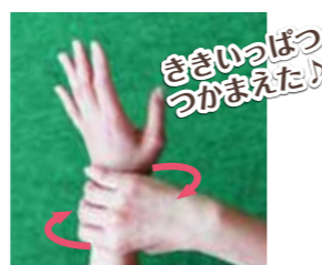
⑥左手首を右手で握って洗い、右手首も同じように洗う。