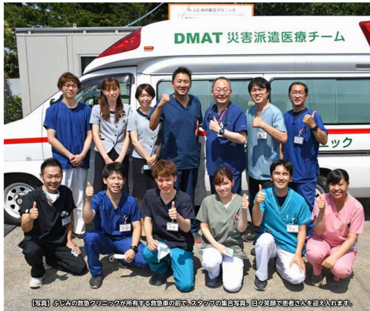
【写真】ふじみの救急クリニックが所有する救急車の前で、スタッフの集合写真。日々笑顔で患者さんを迎え入れます。