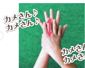
②左手の甲を右手で洗い、右手の甲も同じように洗う。