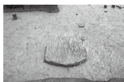
↑炭に全て竹串を刺した様子。最も密集している所が火を燃やした場所と考えられる。

発掘現場からよみがえる、太古の三芳 遺跡からは、土器や石器などのほかに、太古の昔に暮らした人々の様々な痕跡が見つかります。木や草が燃えて残った炭もそのひとつです。炭を科学分析にかけることで、当時の暮らしの様子や自然環境が詳しく分かります。 先月お伝えした藤久保東遺跡でも、火を燃やしたと考えられる場所が見つかり、そこから細かな炭が大量に見つかりました。 それはいつ使われたのか まず、この火はいつ燃やされたものなのでしょうか。その疑問を解決するために、炭の年代を測定できる「放射性炭素年代測定」という自然科学分析を行いました。結果、この炭は約3万年前のものである、つまりこの場所で火を燃やしたのは約3万年前だということが分かりました。 炭からよみがえる当時の風景 では、この炭はなにを燃やして出来たのでしょうか。自然科学分析