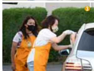
①野菜やフルーツ、お菓子などが詰まったおなかまBOXにメッセージを添えて。②どこにいても目立つ受付担当。③ドライブスルーでおなかまスマイル弁当をお渡し。

誰 でも気軽に参加できる子ども食堂として、2017年にオープンした「三芳おなかま子ども食堂」。毎回100人前後が集まり食卓を囲んできましたが、新型コロナウイルスの影響により3月から中止を余儀なくされました。