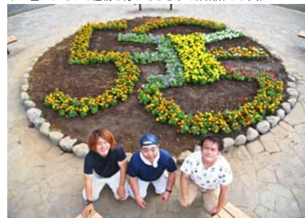
↓2日にわたって植栽を行ったむさしの作業所の3人。

三芳町のそばの作付面積は県内1位*で、初夏と秋には町内各所で栽培風景を見ることができます。この季節は、春にまいた種から成長したそばが1m程の大きさになり、白い花を咲かせる姿が見られます。取材に訪れた北永井の畑では、そばの花が一面に広がり、見頃を迎えていて、中には淡い緑色の実がついている花もありました。*〔農林業センサス2015〕