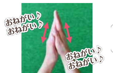
①手のひらを合わせて洗う。