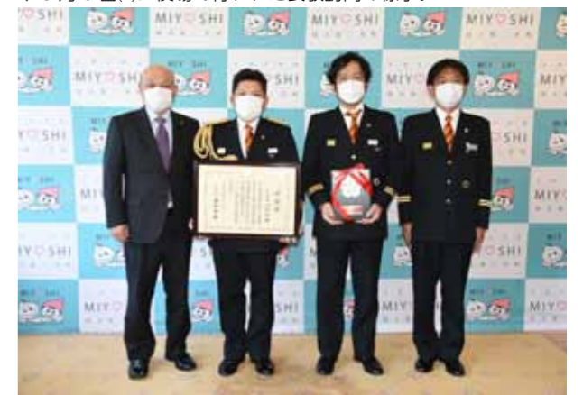
↓5月8日(金)に役場で行われた表敬訪問の様子。

役場庁舎西側の壁面にメディアタワー(懸垂幕装置)を設置しました。6月23日現在は、町制50周年やマレーシアの共生社会ホストタウンをPRする懸垂幕が掲示されています。設置場所は役場の西側を通る町道5号線からも目に入る位置です。これからもこのメディアタワーからイベントなどの告知を行っていきますので、お近くを通った際には是非ご覧ください。