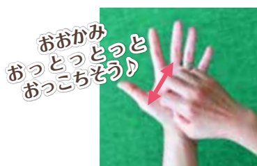
④右手をすぼめた形で指先を洗い、左手の指先も同じように洗う。