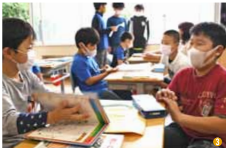
①給食開始日にクラスみんなでいただきます。②休業中、Zoomで子どもの顔を見て安心する先生。③学校再開日、新入生に話し掛け緊張をほぐす6年生。