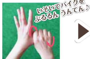
⑤左手の親指を右手で握ってねじるように洗い、右手の親指も同じように洗う。