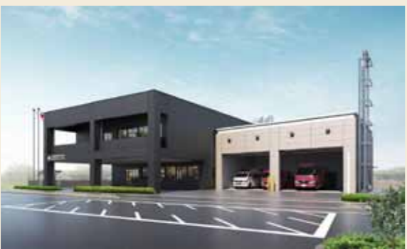
【完成イメージ図】 ※実際とは異なる場合があります。