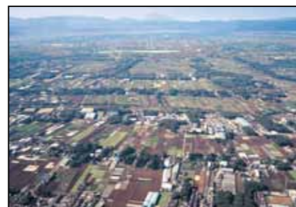
約 300 年前から残る三富新田の景観。先人の想いは今も三芳に残っています。

新しい元号「令和」、130 年前に誕生した「三芳」の名。新しい時代が幕開ける今、三芳