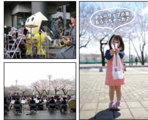
チューリップの苗もらっちゃった♪