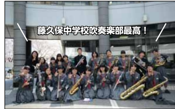
藤久保中学校吹奏楽部最高！

三芳生誕 130 年記念に花を添えたのは、藤久保中学校の吹奏楽部の皆さんによる演奏。途中、スペシャルゲストとしてみらいくんが登場。ちょっぴり前に出たお腹を気にしながら華麗なドラムを披露しました。またオランダのホストタウンということで、来場者にチューリップの苗をプレゼントする企画も行われ、手にした子どもたちは満面の笑顔の花を満開に咲かせていました。