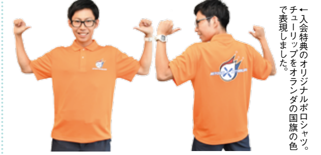
←入会特典のオリジナルポロシャツ。チューリップをオランダの国旗の色で表現しました。

今年4月、オランダ(女子柔道チーム)を相手国とするホストタウンに三芳町が登録されました。今後、オランダ女子柔道チームとの交流事業等、町ぐるみでオランダのホストタウンとしての取組みを進めるため、応援サポーターを募集します。