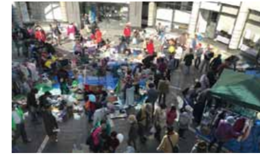
←今年場所は庁舎1階エントランス広場になります。

産業祭で「協働のまちづくりネット・みどり環境グループ」主催のフリーマーケットを開催します。出店をお待ちしております。