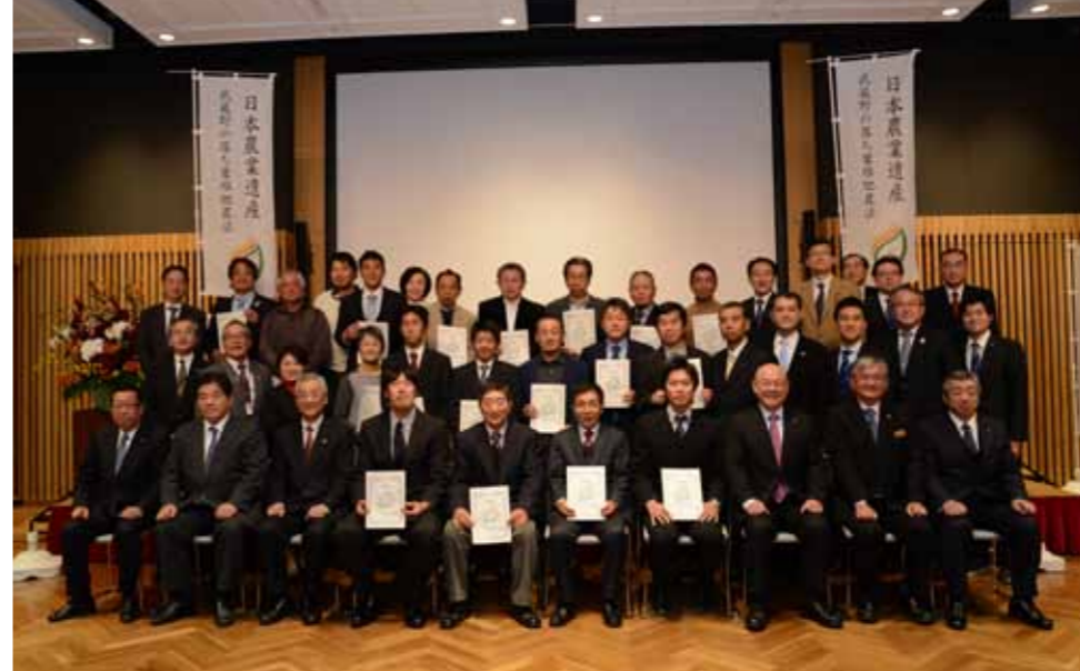
2017年12月に川越で行われた武蔵野の落ち葉堆肥農法日本農業遺産認定記念式典に参加した皆さん。