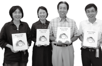
☎ 観光産業課 ☎ 219

「武蔵野の落ち葉堆肥農法」が日本農業遺産認定されたことを記念し、埼玉県のふるさと創造資金の補助を受け「武蔵野の落ち葉堆肥農法」紹介VTR、「日本農業遺産認定」の懸垂幕、「おいしいなあれ富のいも」絵本などの作成を行いました。