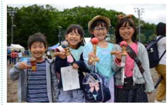
←幅広い年代が楽しむことができるイベントが盛りだくさんです。

ダンスや一輪車パレードを見て楽しんだり、わなげやスーパーボールすくいコーナーなどで楽しむことができるイベントです。ご家族でぜひお越しください。