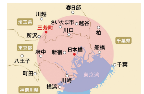
日本橋から30km圏内図。三芳町は川崎市や千葉市よりも都心に近い。