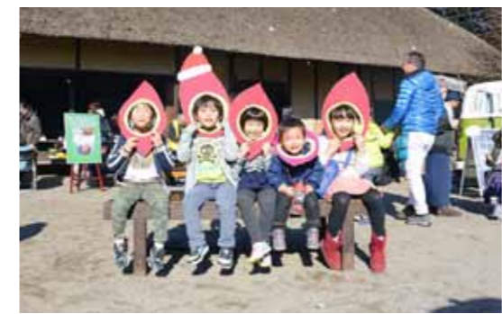
←上富をもっと楽しく！大人も子どもも楽しめます。

今回も三芳町で採れた新鮮な野菜やお茶、地元食材を使ったパン・お惣菜やスイーツ、上富にちなんだワークショップや雑貨などのお店が並び、三芳町を楽しめるマルシェになっています。