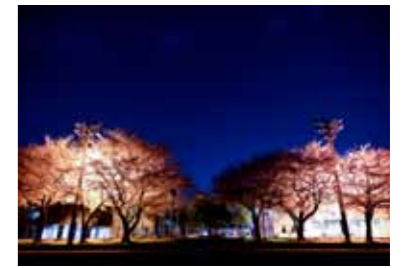
↑親子で夜桜を觀賞する姿も多数見られました。町のオススメスポットです。

春の訪れを感じる桜。今年は例年よりも早く満開を迎え、役場前の桜並木を見ながら花見をする姿が3月下旬ごろから連日見られました。月明かりが桜を照らす景色は、幻想的。常設している街灯が、まるで、桜のためにライトアップしているかのように感じられました。三芳町内の花見の穴場スポット。来年、ぜひお越しください。