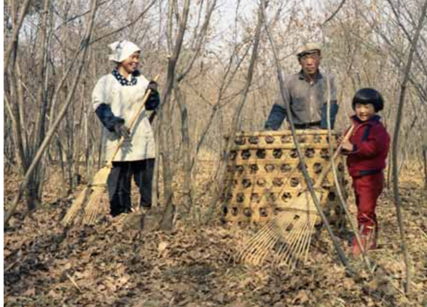
昭和40年代に撮影された、落ち葉掃きをする一家の様子。広大な土地を家族だけで掃いていました。

三 芳町は、武蔵野の美しい平地林と、整然と区画された畑を残す町として広く知られてきました。現在も多く農家で平地林の落ち葉を堆肥にし、手間を惜まずに先人の想いを守りながら、美味しい野菜を生産しています。