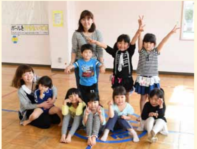
先生やお母さんたちも子どもと一緒にゲームに参加。大人も子どものように、無邪気に盛り上がっていました。

●北永井児童館 ☎258-9962 ●藤久保児童館 ☎258-9965 ●竹間沢児童館 ☎259-8315