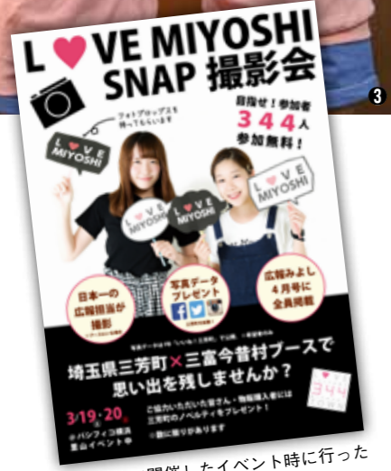
2016春に開催したイベント時に行った SNAP 撮影会の告知ポスター

③工藤遥さんと佐藤優樹さん（モーニング娘。'18）。④2018年春のイベント時で物販のお手伝いをした吉澤ひとみさん。収益は三芳町緑化保全寄附金に。⑤2015年春に初参加したときの様子。⑥2016年春の物販の様子。