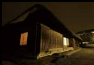
【町内に残る2つの古民家】

写真上は歴史民俗資料館に隣接している「旧池上家」の中。古民家の雰囲気味わいながらさまざまなイベントが行われています。写真右は上富の「旧島田家」。こちらでも体験学習などが行われ、初夏にはカブトムシの幼虫キット作りなども行います。