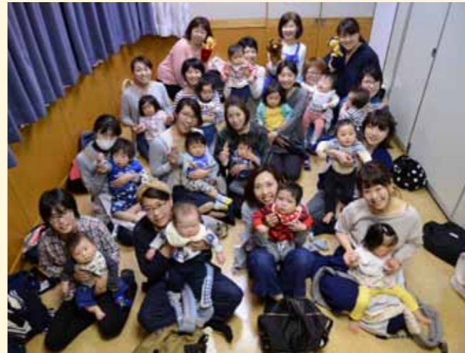
中央図書館に入って左手奥にある部屋で行われるぐりぐらタイム。泣き笑いの声が部屋から聞こえます。