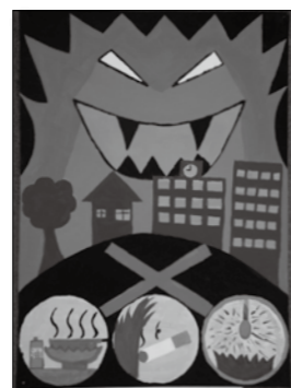
- ポスターの部 - 駒西小学校 齊藤 好花 さいとう このが