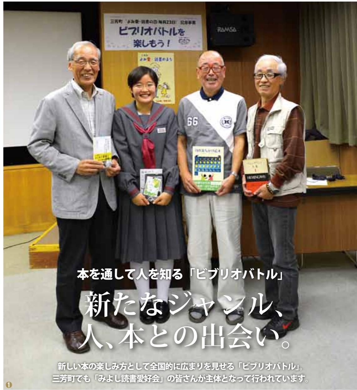
新しい本の楽しみ方として全国的に広まりを見せる「ビブリオバトル」。三芳町でも「みよし読書愛好会」の皆さんが主体となって行われています。

赤ちゃんからお年寄りまで誰もが生涯にわたり読書に親しみ、本を読み合う喜びを共有できるまち——。ビブリオバトル