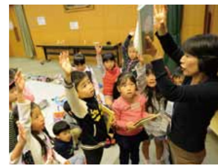
(写真上) 人気のある本は奪い合いに。じゃんけんして借りることができる人を決定。(写真下)ブックトーク(おすすめ本の紹介)の様子。続きが読みたくるように、あらすじを紹介すると「借りたい!」と手が上がります。