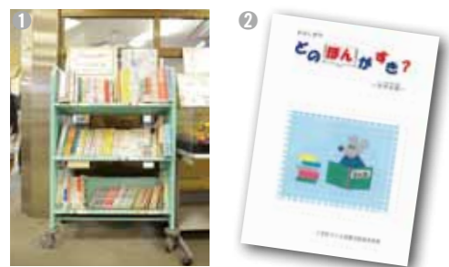
①図書館にもブックリスト「どのほんがすき?」で紹介している本を設置し、大人も読書の喜びを共有できるようにしています。②ブックリストの表紙。とっておきの79冊を収録。かわいらしい表紙で子どもたちの興味をひきます。③リストの一部。思わずその本を読みたくなる紹介文が載っています。

同委員会でも、子どもたちの好みや読書の傾向も踏まえ議論を重ね完成したブックリスト冊子『どのほんがすき?』。「本を読みたいけど、どんな本がいいのか」という悩みに応えるために作られました。この冊子は新入学の1年生に配布し、学年別に全79冊を紹介。大人も活用して、生涯を通じて本の感動を子どもたちと共有できるきっかけとなる三芳町だけの事業です。