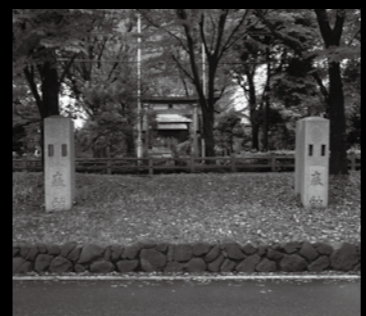
↑木宮稻荷の幟立て(下り車線を挟んだ奥には、木宮稻荷の鳥居が見える)

神社の境内に、写真のような穴が開けられた石柱が立っているのを目にしたことは無いだろうか。これは、祭礼などを告知するための幟を立てる、幟立てという石造物である。 三芳町にある神社境内の多くには、幟立てが立てられているが、今回はその中でも、藤久保字南新埜にある、木宮稻荷神社の風変わりな幟立てについて紹介する。風変わりな点というのは、川越街道を上下線に分ける、中央分離帯内に立っているという点である。 実は、この幟立てが立っている場所は、元々、木宮稻荷神社の境内であった。しかし、川越街道の車線新設に伴って、昭和13年(1938年)に幟立てが立っている敷地を含む木宮稻荷神社の境内地が、道路敷地に組み換えられ、その後、木宮稻荷神社の鳥居と幟立ての間に道路が新設されたことで、現在のように幟立てが中央分離帯に取り残される形となったのである。 御影石で作られた「対」のこの幟立てには「奉納」の文字と、向かって左側のも