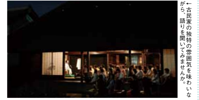
←古民家の独特の雰囲気を感じながら、語りを楽しんでみませんか。

歴史民俗資料館に隣接する旧池上家住宅を会場にして、夜語りを行います。夜の古民家という独特の雰囲気のなか、笑いからちょっと怖い話まで、昔語りを楽しみませんか。