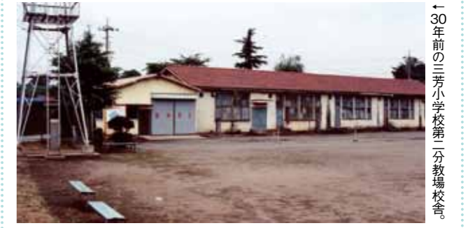
←30年前の三芳小学校第一分教場校舎

歴史民俗資料館開館30周年を記念して、30年前の昭和61年頃に撮影された町内風景写真で景観の変化を振り返ります。当時から知らない人は新鮮、知っている人は懐かしい風景。ぜひご来館ください。