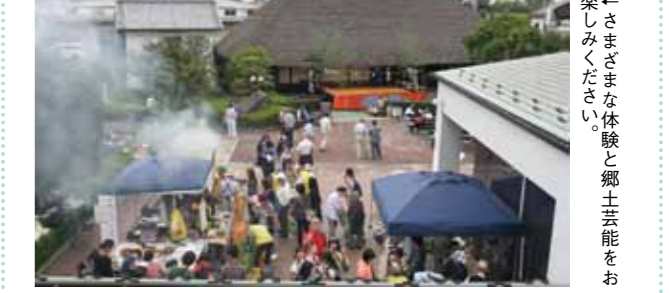
←さまざまな体験と郷土芸能をお楽しみください。

毎年恒例の資料館まつり。「第1部・歴史、文化を体験」では昔の民具体験や藍染め体験、埴輪ストラップ作り、まが玉作りなどの体験イベントを実施。「第2部・郷土芸能鑑賞」では竹間沢の里神楽と藤久保のお囃子の公演を実施。名物の焼き団子やさつまいものほろろ焼き、懐かしの駄菓子販売も行います。