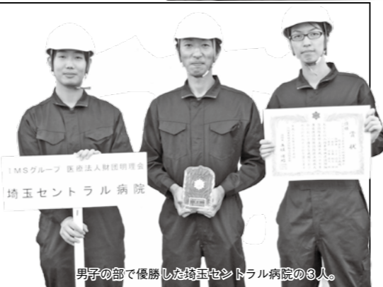
男子の部で優勝した埼玉セントラル病院の3人。

10月15日(日)、東消防訓練場で実施した自衛消防隊消防操法競技大会で三芳町内の埼玉セントラル病院が見事、男子の部で優勝しました。この競技大会は「自分たちの職場は自分たちで守る」を理念に、事業所など26チームの出場により屋内消火栓操作技術向上と、防火意識の普及を目的として毎年行われています。準優勝は三芳町役場でした。また、女子チームの優勝は『大日本印刷株式会社上福岡工場』でした。