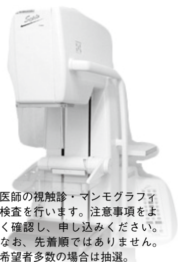
医師の視触診・マンモグラフィ検査を行います。注意事項をよく確認し、申し込みください。なお、先着順ではありません。希望者多数の場合は抽選。

申込前の注意事項…妊娠している、可能性のある人、授乳中の人▽豊胸術をした人▽胸壁に人工物が入っている人▽乳房の手術後1年以内の人▽検診バスへの移動に不安のある人※卒乳後1年未満の人は事前に相談してください