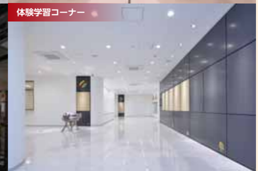
体験学習コーナー