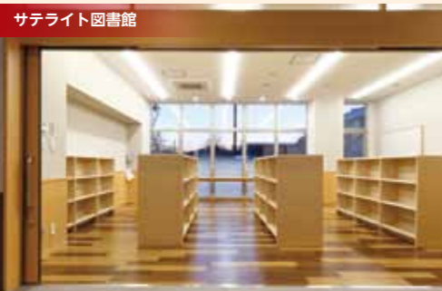
サテライト図書館