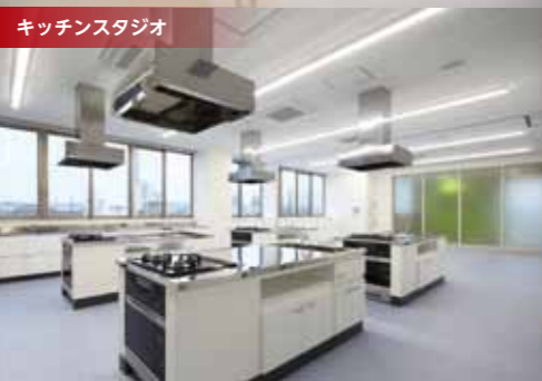
キッチンスタジオ