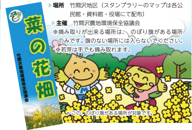
←この、のぼり旗がある場所が対象です。