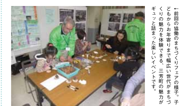
←前回の協働のまちづくりフェアの様子。子どもからお年寄りまで幅広い世代がまちづくりの魅力体験できる、三芳町の魅力がギュッと詰まった楽しいイベントです。

ま ちづくりの魅力を、楽しみながら身近に感じることができるイベント「協働のまちづくりフェア」。町内で活躍している様々なまちづくり団体が参加。特にボランティアに興味のある人、地域デビューしたい人は、ぜひ会場へお越しください。子どもも楽しめるイベントも企画しています。