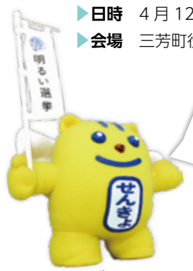
(明るい選挙のイメージキャラクター選挙のめいすいくん)