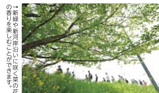
→新緑や新河岸沿いに咲く菜の花の香りを楽しむことが出来ます。