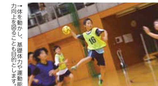
→体を動かし、基礎体力や運動能力向上を図ることも目的とします。

ハ ンドボールの基本、パス・キャッチ・シュートを通じてコミュニケーションの向上、ハンドボールの楽しさをゲームをしながら体感します。また、未経験者でも安全で安心して練習できます。