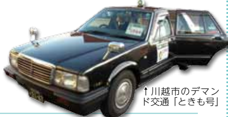
↑川越市のデマンド交通「ときも号」

新 なた 公共交通として「デマンド交通」の試行運転を秋に実施します。デマンド交通とはバスでもタクシーでもない新しい移動手段です。町内各所に停留所(共通乗降場)を設け、タクシー車両を使いバスのように乗合をして運行を行います。運行に先立ち、このデマンド交通の愛称を募集します。(運行の詳細は後日広報などでお知らせします。)