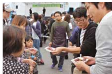
←大熊町ふるさとまつりで、さつまいもを提供する様子。現地さつまいもに好評でした。

町は、福島県大熊町に被災地支援を行っています。今年も「おおくまふるさとまつり」に参加し、さつまいもを無償提供します。その協力をしていただけるボランティアを募集します。