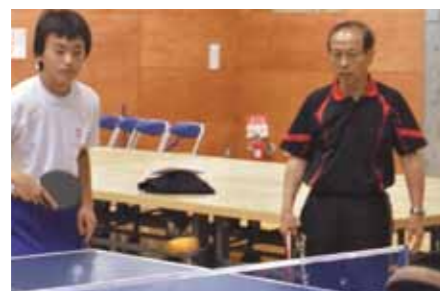
←講師の近藤氏は41連続イン ターハイ出場。1993年から 日本代表女子監督として福原愛 ら日本トップ選手を指導。

今年の卓球世界選手権のテレビ解説でもおなじみの、全日本女子卓球チーム前監督、近藤欽司氏を講師に招き、卓球教室を開催します。