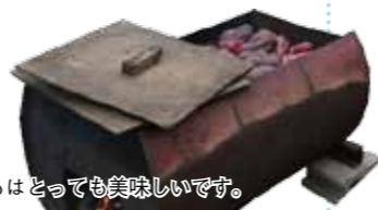
できたてホヤホヤの焼きいもはとっても美味しいです。