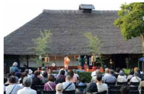
←地域焼きいもや焼き団子を食べながら、お囃子、里神楽などを楽しめます。

焼きいも・焼き団子・ラムネ等の販売、藍を使った染色・どんぐり塗装などの体験コーナーのほか、町に伝わる里神楽やお囃子の公演もあります。ぜひお越しください。