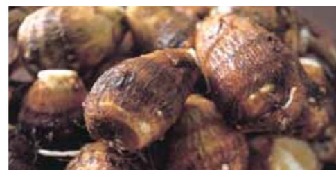
「里芋の仕上げや、どの収穫をします。落花生など」

味の魅力(みよしのみりょく)を体験! 秋の野菜を収穫しませんか。里芋の仕上げ体験や落花生の収穫など、お店に並ぶ前の野菜の姿を楽しく学びましょう。