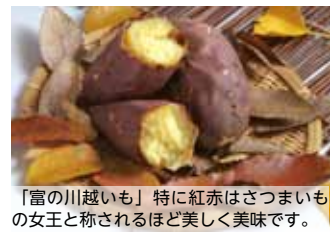
「富の川越いも」特に紅赤はさつまいもの女王と称されるほど美しく美味です。

今回のプレゼント協力は三芳町川越いも振興会さん。メンバーは上富のサツマイモ生産者の皆さんです。「富の川越いも」の消費拡大に向け、様々な試みを行っています。