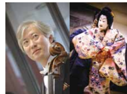
「チェロ奏者の渡邊辰紀が古民家(旧池上家)で夢の響宴を行います。当日はチェロ・コンサートのほか、車人形の動きに合わせてアドリブでチェロを演奏するなど、その瞬間にしか味わえない音楽を堪能できます。」

二 芳町の郷土芸能「竹間沢車人形」と東京フィルハーモニー交響楽団首席チェロ奏者の渡邊辰紀が古民家(旧池上家)で夢の響宴を行います。当日はチェロ・コンサートのほか、車人形の動きに合わせてアドリブでチェロを演奏するなど、その瞬間にしか味わえない音楽を堪能できます。