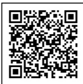
↑QRコードで簡単に応募できます。

申込方法…電話、FAX、メール、QRコードで申し込み。メール、FAXの場合は以下の必要事項を記入。 必要事項：①〇〇申し込み②参加されるママの名前③住所④電話番号⑤子どもの名前と生年月日⑥何番目の子どもか⑦兄（姉）の参加の有無 ☎258-1236 FAX 258-5994 ✉hoken@town.saitama-miyoshi.lg.jp