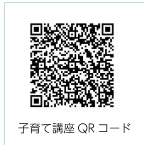
子育て講座 QR コード