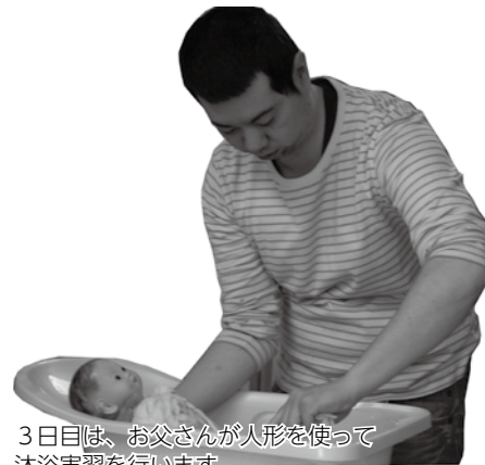
3日目は、お父さんが人形を使って沐浴実習を行います