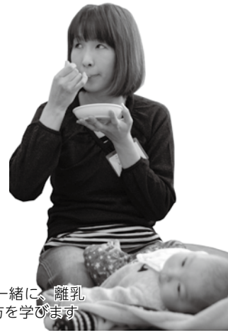
赤ちゃんと一緒に、離乳食の作り方を学びます