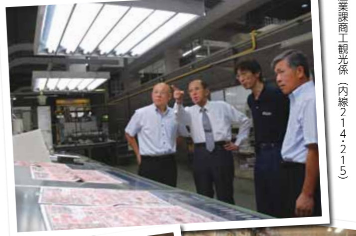
問 観光産業課商工観光係 (内線214・215)