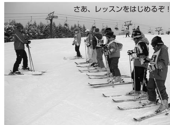
さあ、レッスンは始めるぞ!

かしてスキーを十分に楽しめるまでになりました。子どもたちは自分でリフトに乗り、自力で斜面を下ってきます。引率の先生はコース上のいくつかのポイントで安全確認をすればよいほどに上達していました。1時間足らずの自由滑走の時間でしたが、子どもたちは時間を十分に使い、何度も何度もスキーの滑りを楽しんでいました。一泊二日の短いスキー教室でしたが、雪国の様子を見たり、スキーの楽しさを体験したりすることは、小学校生活の思い出として子どもたちの心の中にいつまでも残ることでしょう。