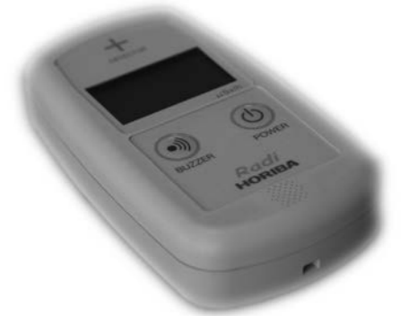
▲貸出する簡易放射線測定器

2月13日(月)から貸し出し開始します 町では、町内に居住している人または、町内に事務所を有する個人及び法人の人が町内で空間放射線量を測定することに對して、簡易測定器(大気中の放射線量を測定する機器)の無料貸出しを始めます。 【貸出機器】 (株)堀場製作所製環境放射線モニタ I PA-11000 Radi 【貸出開始日】 2月13日(月) 【貸出期間】 平日午前9時から貸出し、同日の午後4時までに返却(土・日曜日、祝日、年末・年始は除く) 【貸出台数】 1回につき1台 【貸出方法】 電話または環境産業課窓口で予約をし、貸出日に申請書を提出してください。申請に当たり健康保険証・運転免許証・その他申請者本人であることが確認できる書類をご持参ください。法人の場合は、町内に事務所を有することが確認できる書類をご持参ください。