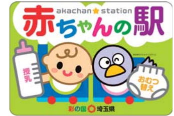
「赤ちゃんの駅」ステッカー