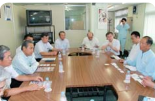
▲視察後の懇談会の様子

境マネジメントシステム」をそれぞれ取得されました。 平成20年の売上高は200億円を越え、本年の決算でも250億円を超え、業績は順調に推移していること。また、製品は、森水製菓(株)「ワイドラインゼリー」、(株)ロッテ「クリッシュ」、明治製菓(株)「カール」、森水製菓(株)「アロエヨーグルト」、大塚製菓(株)「SOYJOY」、丸美屋食品工業(株)「のりたま&パ