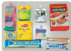
▲独創的なオリジナル包材の数々

昭和54年には三芳第二工場が完成、翌55年に東京パックに初出展、昭和61年には三芳工場が軟包装衛生協議会認定工場となったこと。平成7年「デュボンアワードダイヤモンド賞」を受賞、平成13年には同じく「デュボンアワード」を受賞、平成15年に「ISO9001(品質マネジメントシステム)」、平成18年に「ISO14001(環