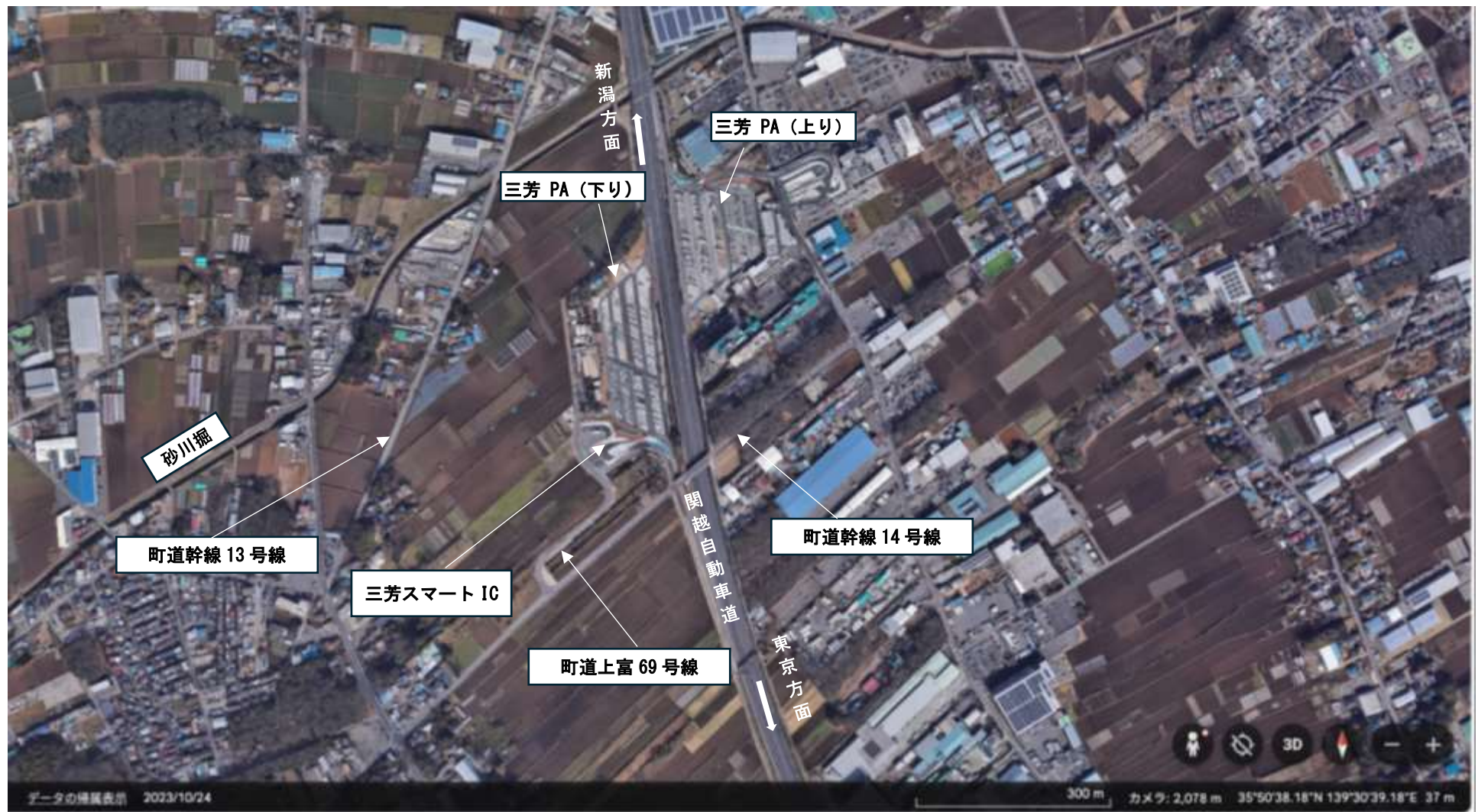
別紙 2 計画位置図、計画区域図