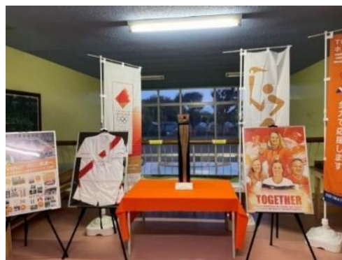
※左：秘書広報室前、右：上富小学校