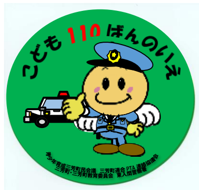
「子ども110番の家」ステッカー

★玄関先や店舗の出入口など「子どものよく見えるところ」に、子ども110番の家のステッカー（参考）を貼ってください。