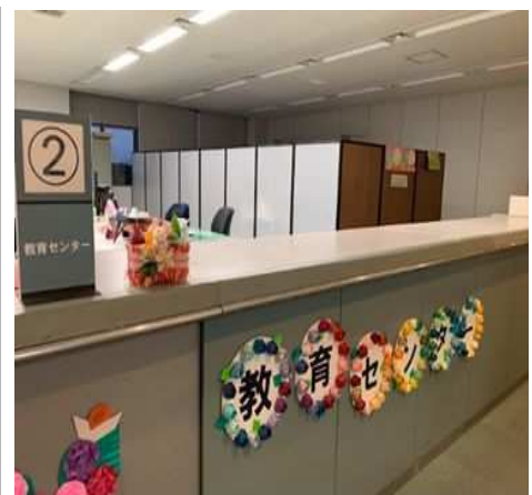
教職員向け相談サロン兼教育資料室