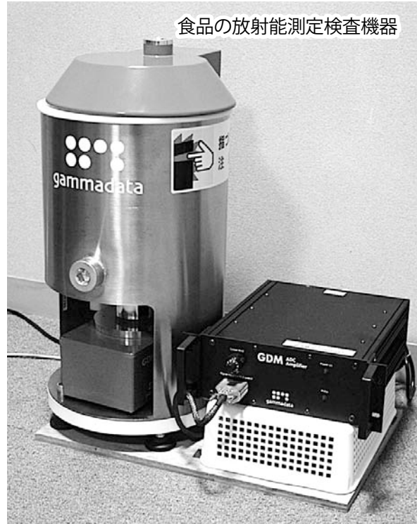
食品の放射能測定検査機器

決算特別委員会での審査中、委員間の自由討議でさまざまな意見がありました。主な意見は、決算特別委員長が本会議で報告し、その結果を受け審議されました。