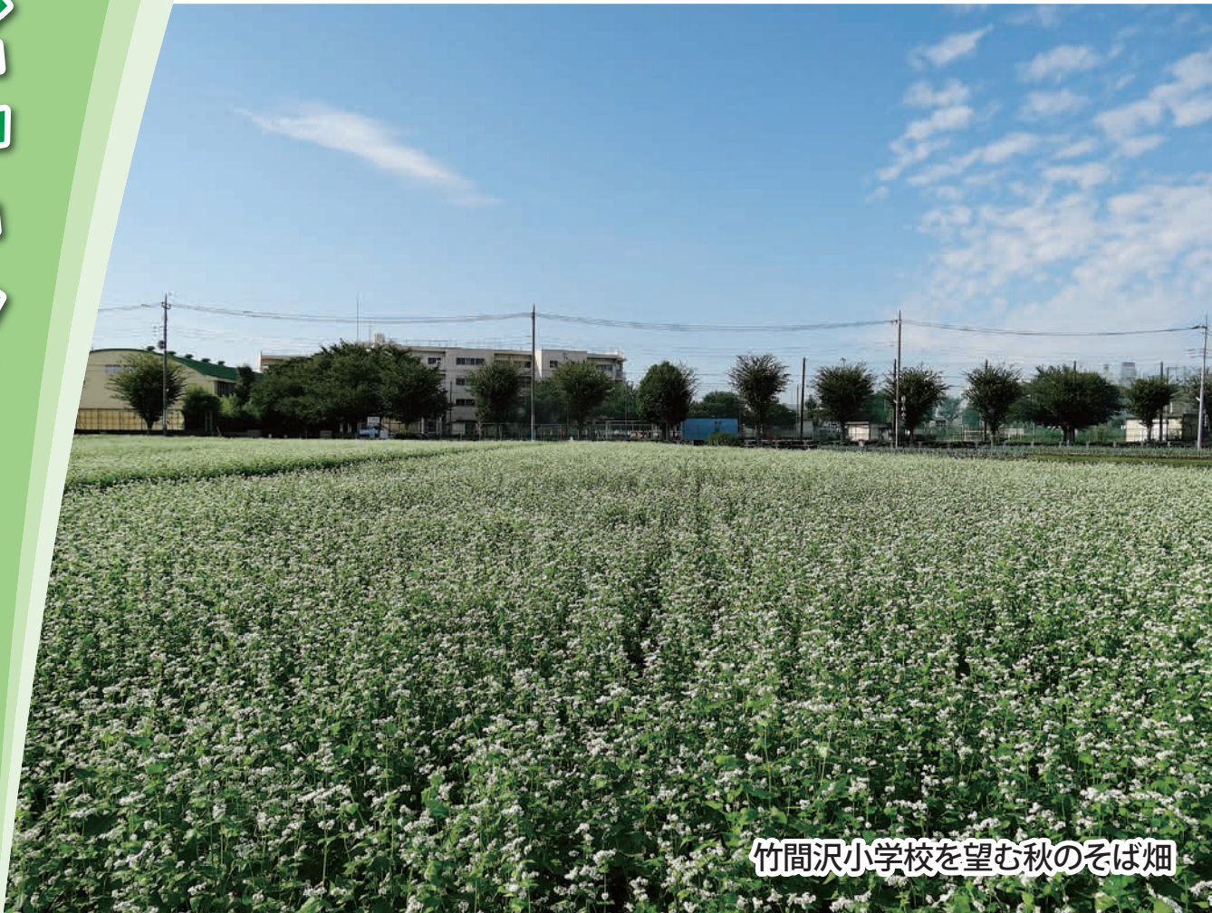
竹間沢小学校を望む秋のそば畑