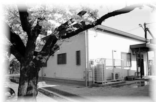
新設された竹間沢第2学童保育室