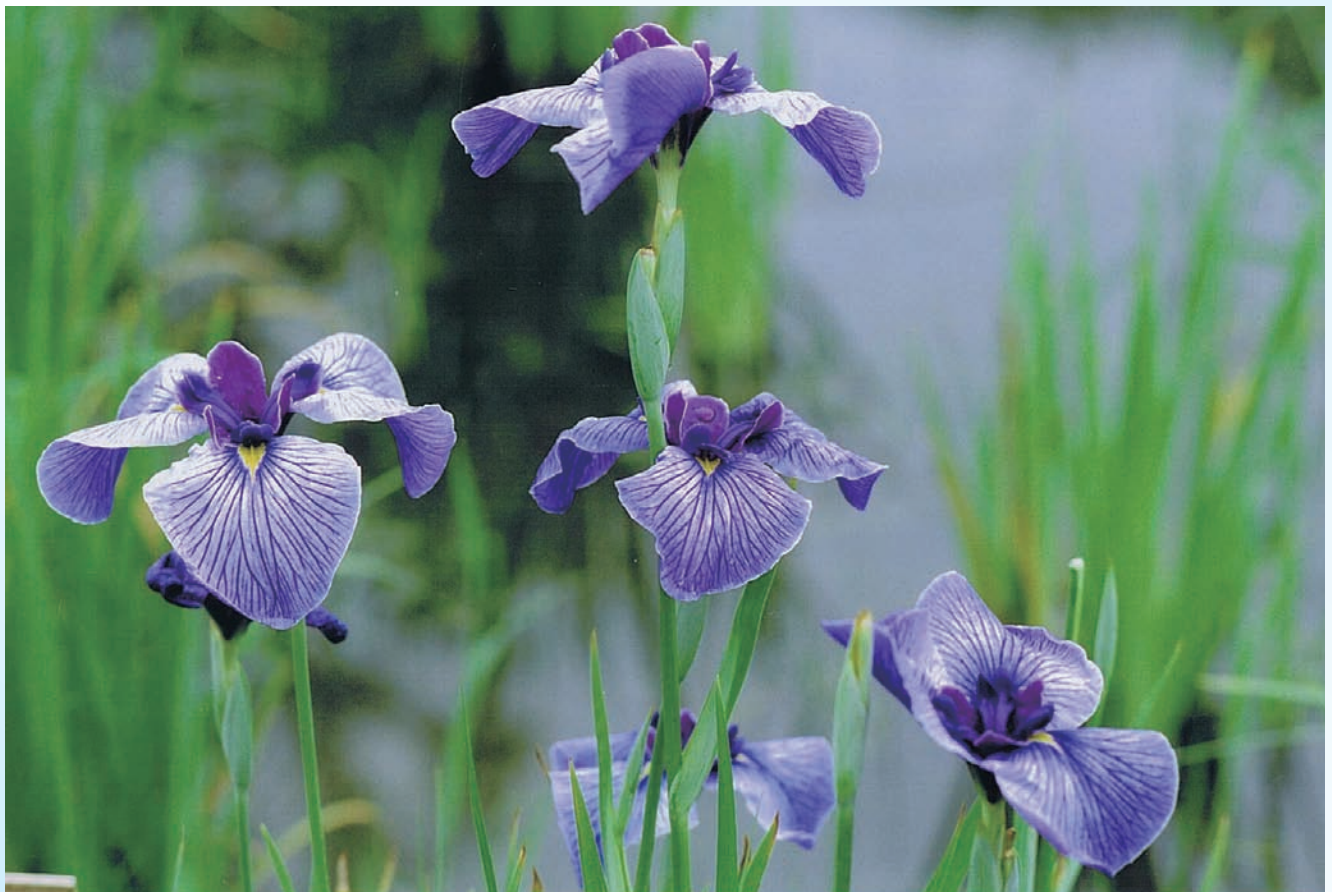
5月の花 うれしい便り