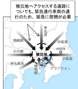
(首都直下地震における八方向作戦の例)