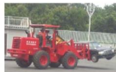
車両移動のための具体的方策 (例:ホイールローダーによる移動)