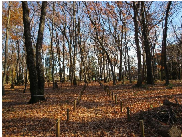
散策路の落ち葉を集めています