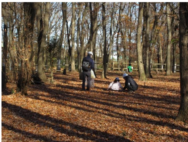
参加した子供さんも枝集め