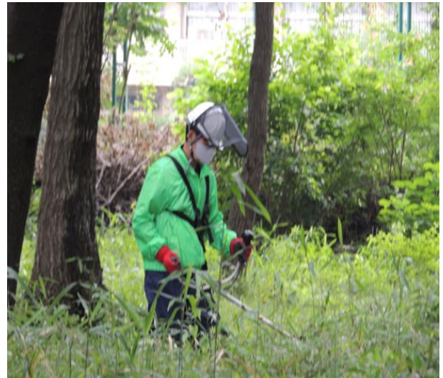
人の腰くらいまで伸びています