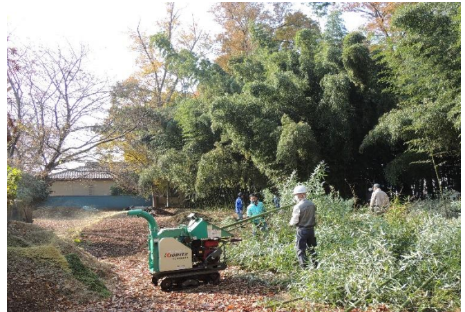
竹を破砕機で破砕中