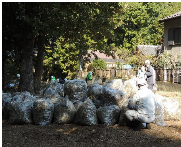
収集した草を集めています。(右側は住宅)