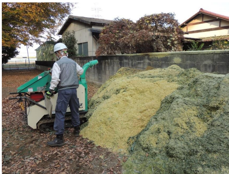
破砕後の竹のチップ この後落ち葉に混ぜて堆肥にするそうです

次回 12月20日(日)は1月の落ち葉掃き準備の最後の作業となりますのでトラストC・D地区の草や枝集めなど林内整備作業を実施する予定です。