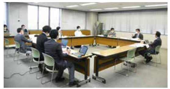
↑ 4/14(木)に開かれた事業者選定委員会の様子。